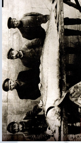
Złowiony w Odrze jesiotr na początku XX wieku

Wykorzystanie gospodarze odrodzonych zasobów jest sprawą dalekiej przyszłości, ale takiej możliwości nie powinno się z góry wykluczać.