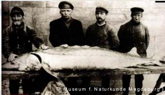
Störfang zu Beginn des 20ten Jahrhunderts

Auch das Leben der hier ansässigen Bevölkerung hat er nachhaltig geprägt. Durch die zunehmende Umweltverschmutzung und Gewässerverbauung wurden seine Lebensgrundlagen und die vieler anderer Wanderfische weitgehend zerstört. Drastische Überfischung, vor allem der verbliebenen Laichtiere, besiegelte dann das Schicksal dieser Art zum Anfang des 20. Jahrhunderts endgültig.